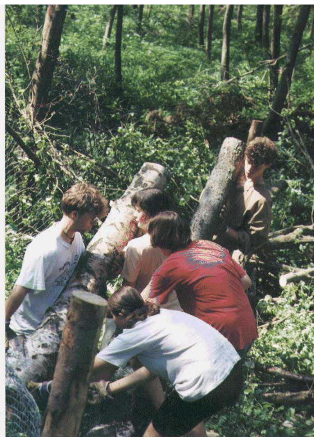
Odklizení polomů po přivalových deštích