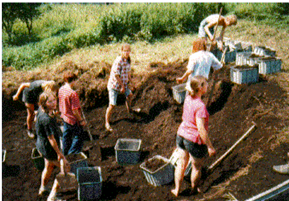
Terénní úpravy okolí hradu Lukova

V neposlední řadě členové Hnutí odpracovali nemálo hodin i dnů při pomoci obcím a jednotlivcům postiženým povodněmi v uvedeném roce, a tato pomoc pokračuje i v následujícím, tedy 98. Roce - ZČ Citadela Jeseníky - pomoc při rozborech vody ze studní, které byly při povodních zničeny či znečištěny, poradenský servis pro jejich obnovu, čištění a zřizování nových. Tato akce je prováděna s pomocí nadace NROS, a ve spolupráci s obecními úřady postižených obcí.