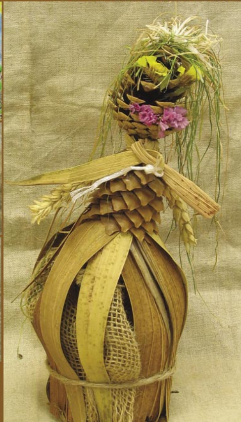
Ukázky prací ze soutěže Máme rádi přírodu